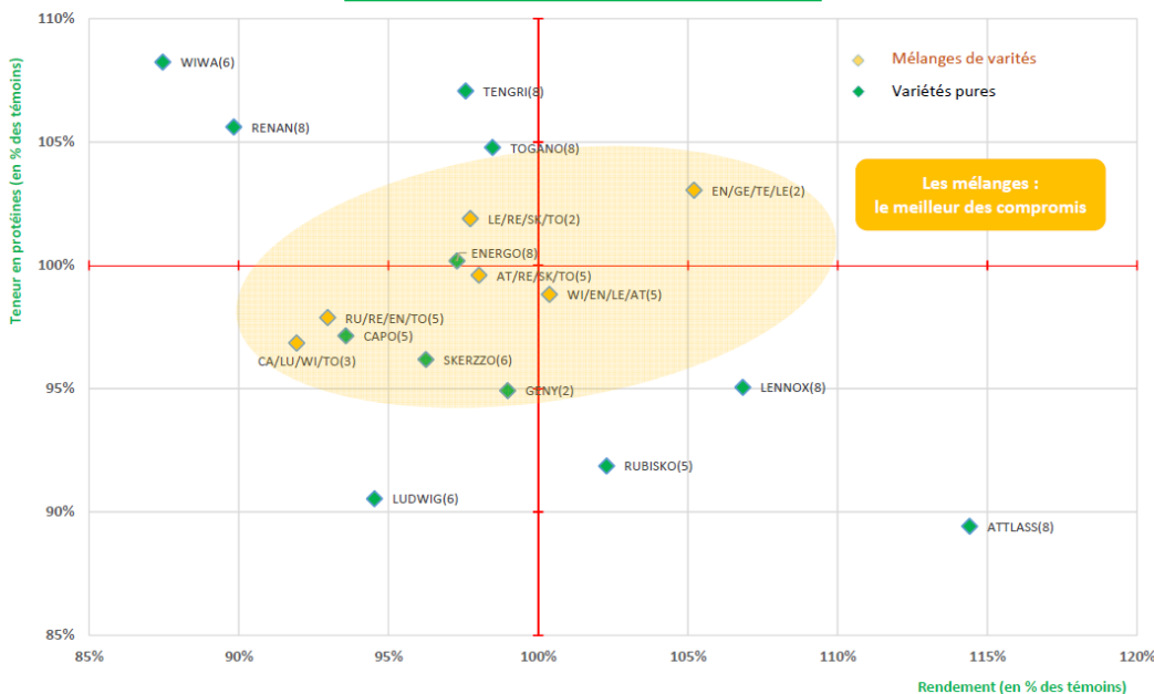
Mélanges de variétés de Blé - Récoltes 2015 à 2019 (5 ans) Région Lorraine - 9 essais (54-55-57)

Les essais des dernières années nous permettent également de mettre en évidence l'intérêt des mélanges. Ils sont toujours bien placés et représentent une assurance qualité et rendement (+/- 5 % de la moyenne en rendement et protéines quand les variétés solo sont à +/- 10 %). À noter, très bon positionnement de notre mélange cette année : ENERGO/GENY/TENGR/LENNOX .