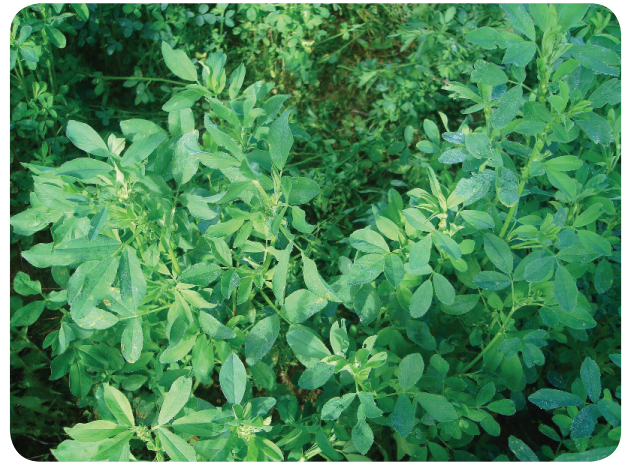
Stade de début de bourgeonnement

ALICIA : variété récente, résistante à la verse, à fort taux protéique.