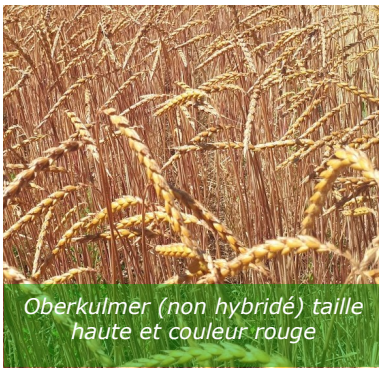
Oberkulmer (non hybridé) taille haute et couleur rouge

Statistiquement, aucune différence n'est mise en avant entre les différentes variétés. Le petit épeautre et l'épeautre non hybridé arrivent juste derrière les 2 épeautres hybridés. Au niveau des qualités, très peu de différence entre les 4 variétés.