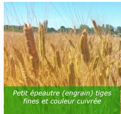
Petit épeautre (engrain) tiges fines et couleur cuivrée

Dans tous les cas, ne pas semer si le débouché n'est pas assuré. La contractualisation est obligatoire pour ce type de culture !!!