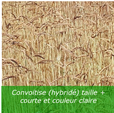
Convoitise (hybridé) taille + courte et couleur claire